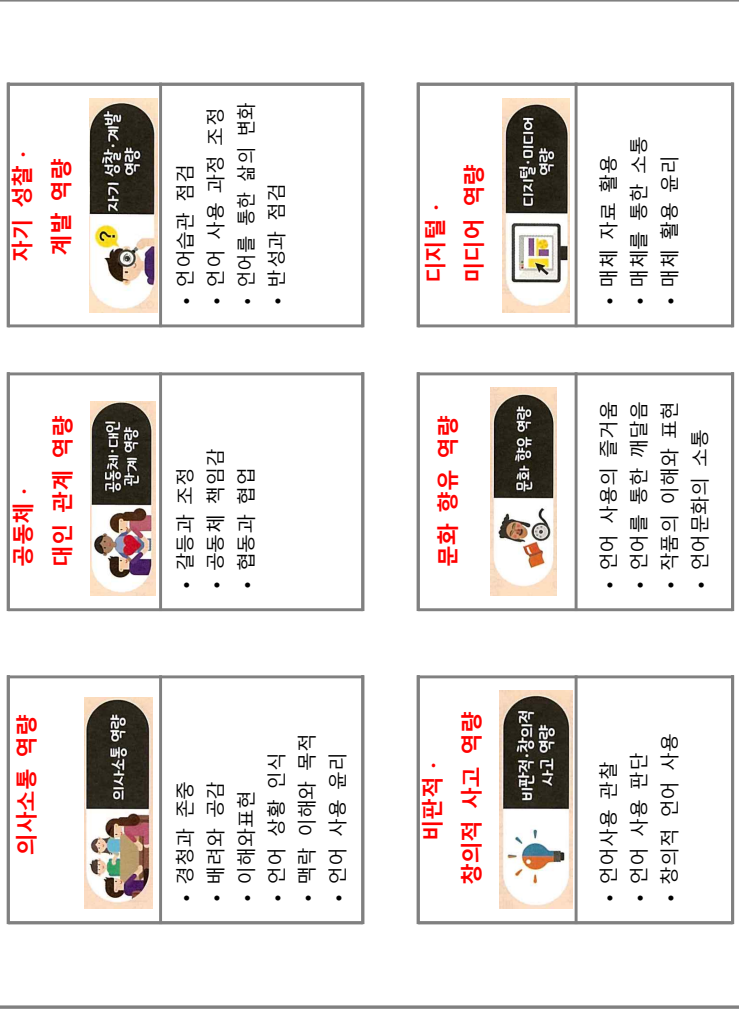
【해설: 출처 - 2022개정 지도서 총론】

국어과 공통 교육과정의 '내용 체계'는 '지식·이해', '과정·기능', '가치·태도'의 세 범주로 구분하여 설정하였다. 듣기·말하기, 읽기, 쓰기, 매체 영역의 경우, '지식·이해'는 의사소통의 맥락과 유형, 과정·기능은 의사소통의 과정과 전략, '가치·태도'는 흥미, 호응감 등과 같은 정의적 요소를 중심으로 내용 요소를 구성하였다. 문법 영역의 경우, '지식·이해'는 언어의 본질, 맥락, 규범 등, '과정·기능'은 국어의 분석, 활용, 성찰, 비판 등 탐구 활동 관련 요소, '가치·태도'는 국어에 대한 호기심, 민감성 등과 같은 정의적 요소를 중심으로 내용 요소를 구성하였다. 문학 영역의 경우, '지식·이해'는 문학의 갈래와 맥락, '과정·기능'은 문학 작품의 이해, 해석, 감상, 비평 등 문학 활동 관련 요소, '가치·태도'는 문학에 대한 흥미와 타자 이해, 가치 내면화 등과 같은 정의적 요소를 중심으로 내용 요소를 구성하였다.